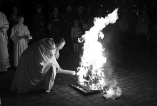
Slavení Velikonoc, Bible 24