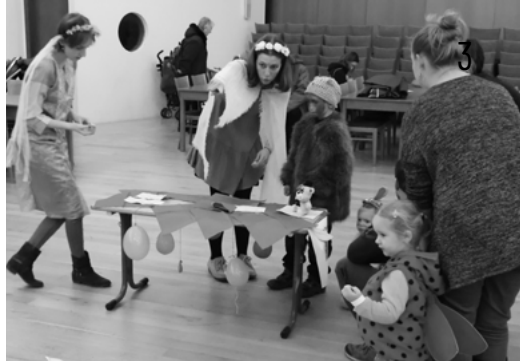
↓ Popelční středa