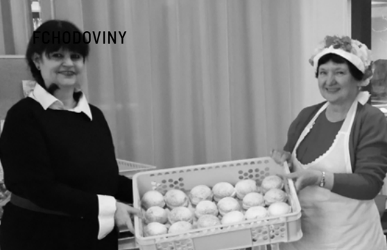
↑ Farní masopust