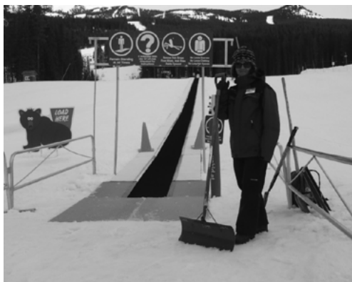
Než začala práce na vleku pro začátečníky v Lake Louise, únor 2013

Pobyt jsem si prodloužila na tři týdny, abych navštívila i jiná místa v Brazílii. Například známé vodopády Iguazú (na hranicích Argentiny a Brazílie) atd.