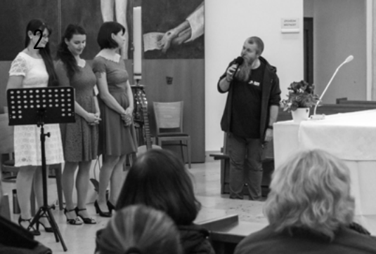
↑ Koncert pro farní dárce a dobrovolníky