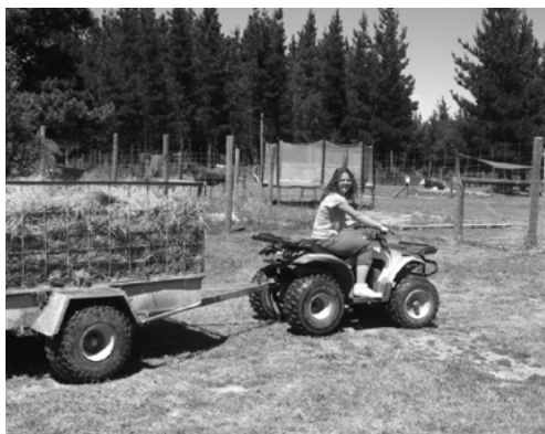
Jana na Novém Zélandu, farma Waiariky, Hamner Springs, 2009

Odpověděla jsem na e-mail s nabídkou stát se dobrovolnicí v cisterciáckém klášteře v Romontu ve Švýcarsku. Tam jsem strávila tři měsíce. Primárně jsem se zde starala o sestřičku, která měla Alzheimerovu chorobu. Občas jsem pomáhala v knihovně, na zahradě nebo v kuchyni. Jedna sestřička mě učila francouzštinu. Zase jsem se mohla více věnovat duchovnímu životu. V Norsku jsem mohla navštívit katolickou mši asi jen jednou (jsou zde luteráni), tudíž tady jsem si to mohla vynahradit.