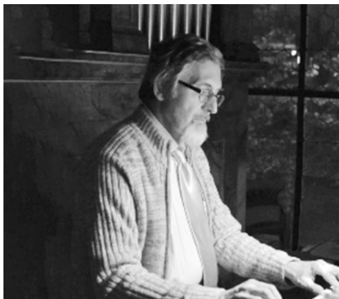
Ve svém živlu. Noc kostelů v Kunraticích. 2019

Jsem humorista. Na výtku již zesnulého P. Stanislava Hrácha: „Vy jste jenom konzumenti, chodíte jen v neděli do kostela na mši svatou, co dělá každý z vás pro šíření víry ve svém okolí?“ mohu sám za sebe odpovědět: „Já nic, já muzikant!“