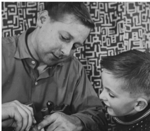
„Tatínek mi ukazuje elektroniku.“ 1960, Praha

kově ústavu a nyní je se mnou doma. Protože má 3. stupeň invalidity, nemůže být zaměstnán.