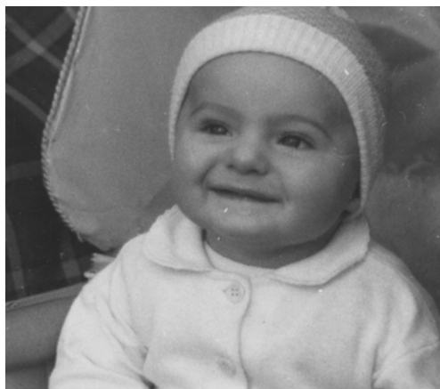
„Dětství jsem prožil v Unhošti u babičky.“ 1958

Potom jsem si podal přihlášku na ČVUT, kde jsem byl přijat na obor radioelektronická zařízení. A v roce 1982 promoval.