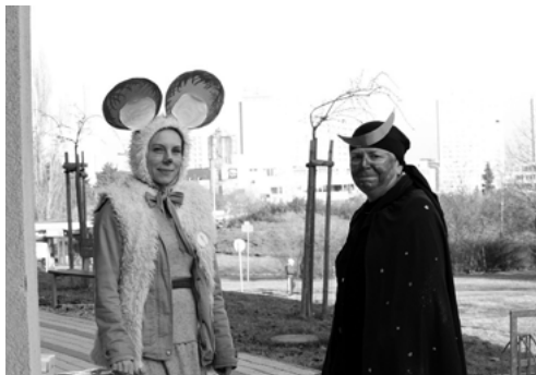
Foto: Masopustní průvod 2023