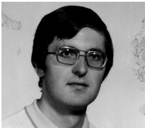
Na střední průmyslové škole. 1975, Praha

Za krátký čas mě pak požádal, jestli bych místo něj nemohl hrát ve všedních dnech u sv. Josefa na Malé Straně. Já jsem tuto nabídku přijal a tam jsem svou budoucí manželku potkal.