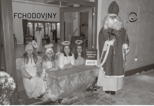
↑ Mikulášská nadílka v KCMT