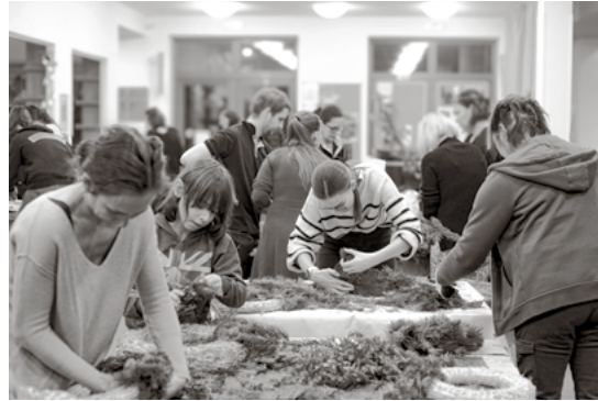
↓ Dobrodinci na Dobrodni