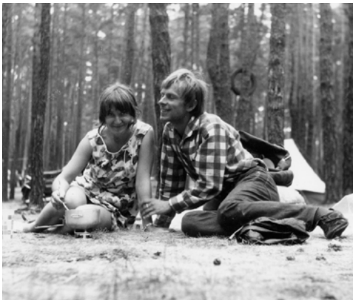
Na svatební cestě v létě 1973 u Máchova jezera.