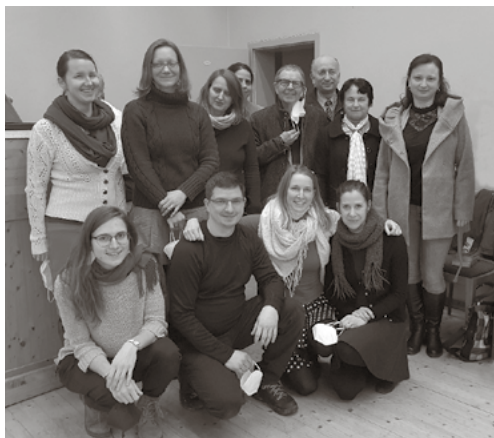
Schola téměř v kompletním složení.