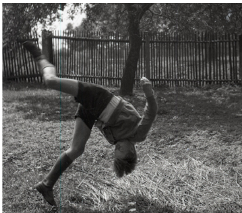
Akrobatické kousky na zahradě fary ve Žlunicích.