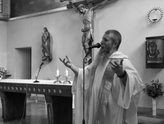
↓↑ Farní den 7. 10.