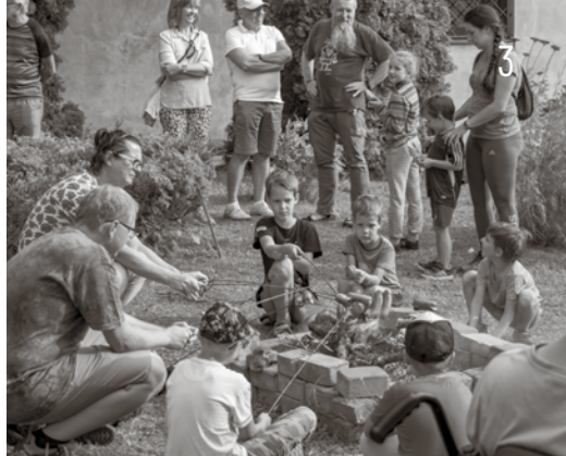
↑ Chodovské posvícení, ↓ Modrobílá neděle