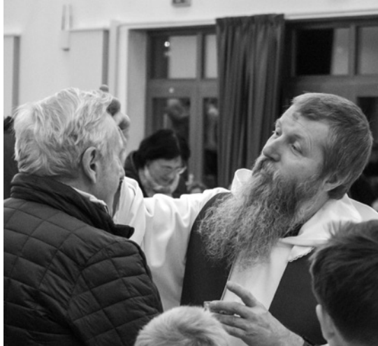
↓ ↑ Popeleční středa v KCMT