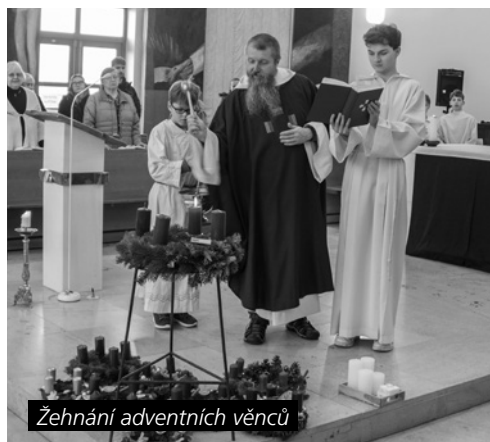
Žehnání adventních věnců