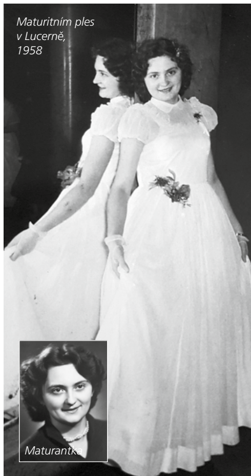
Maturitním ples v Lucerně, 1958