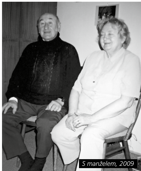
S manželem, 2009