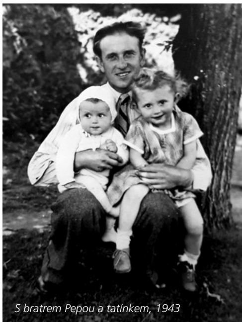
S bratrem Pepou a tatínkem, 1943

Šla jsem na čtyři roky na Hospodářskou školu v Masné ulici. Než se mému strýci narodilo první dítě, bydlela jsem u nich v malém bytě. Pak jsem se tam ale už nevešla, bydlela jsem tedy u jedné staré paní v podnájmu, ale ta brzy zemřela, a tak jsem od druhého pololetí ještě v prvním ročníku začala bydlet na internátě ve Francouzské ulici. Po maturitě jsem pracovala v Centrotexu v Praze 7.