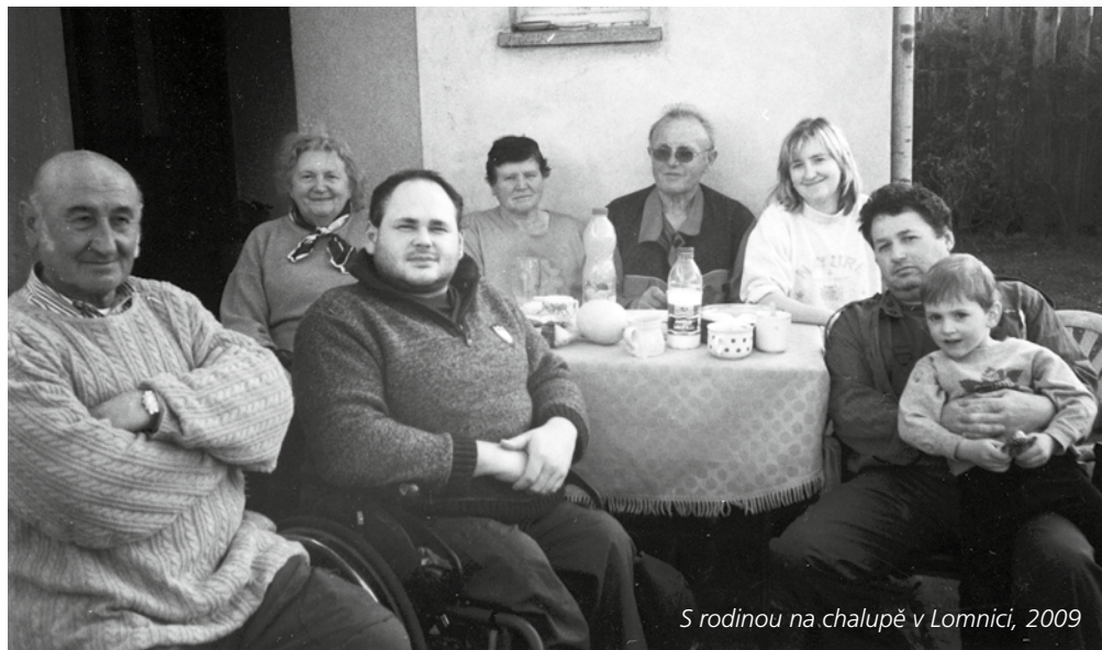
S rodinou na chalupě v Lomnici, 2009

se mi také názory a postoje sv. Jana Pavla II. a současného papeže Františka.