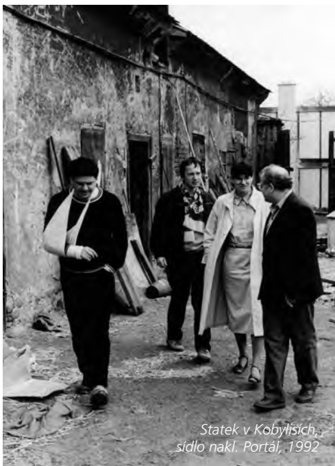
Statek v Kobylisích, sídlo nakl. Portál, 1992

Jsem přesvědčen, že ve svém dosavadním životě jsem pociťl třikrát Boží zásah.