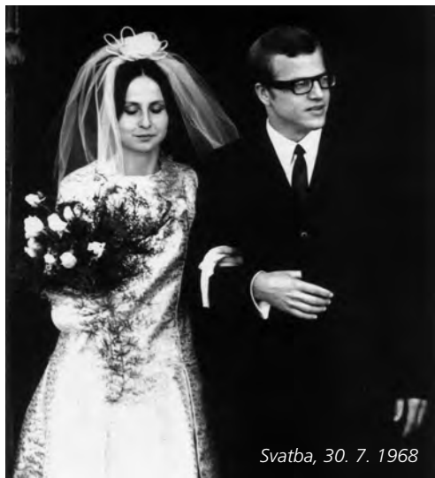
Svatba, 30. 7. 1968