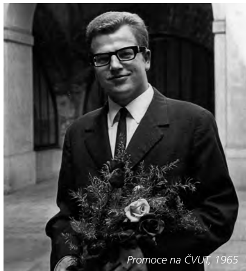
Promoce na ČVUT, 1965

Jak naše rodina mohutněla, několikrát jsme se stěhovali, bydleli jsme nejdříve na Strži, posléze