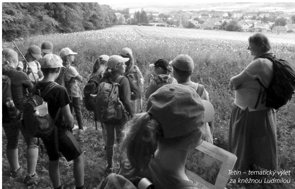
Tetín – tematický výlet za kněžnou Ludmilou

gelíkům i katolíkům zároveň. Po sepsání své diserta- ce jsem se pak díky navázaným kontaktům do Sva- té země znovu vrátila. Celkem jsem ve Svaté zemi prožila pět let a nesmírně mě to obohatilo. Nyní se snažím předávat to, co jsem tam získala, dál. Jsou to především souvislosti biblických textů a reálií, které nelze jednoduše načíst, a potom vztah k této zemi.