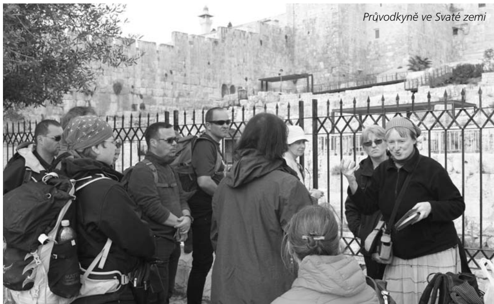
Průvodkyně ve Svaté zemi