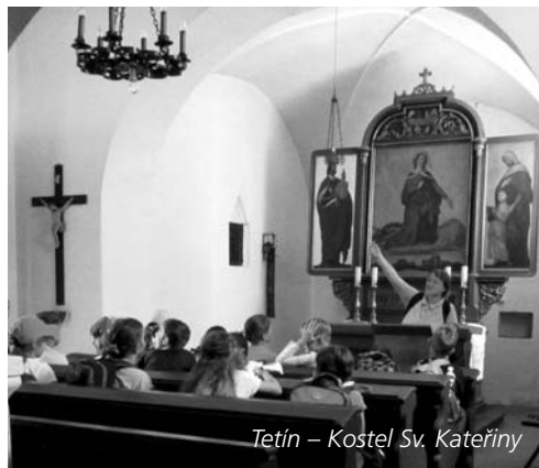
Tetín – Kostel Sv. Kateřiny

Každému! Jsme otevřené společenství lidí, kteří se spolu scházejí, učí a hledají cesty, jak porozumět Písmu. Můžeme se obohacovat navzájem, můžeme hledat, sdílet se, nesouhlasit, vyjasňovat si své obtíže s textem, ale také třeba jen mlčet a naslouchat ostatním. Bůh respektuje naši svobodu – a my se to učíme od Něj. Přijďte, zkuste, budete vítáni!