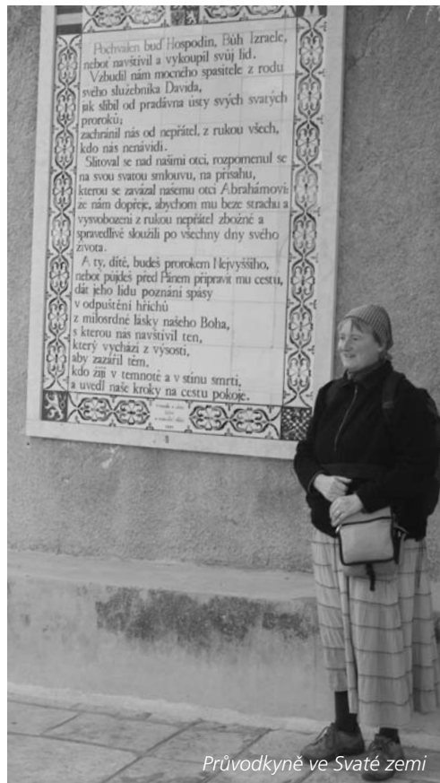
Průvodkyně ve Svaté zemi

Teologii jsem studovala na CMTF v Olomouci ve třech etapách, nejprve dálkově „křesťanskou výchovu“, z níž jsem si v době svého pedagogického působení na VOŠP ve Sv. Janu pod Skalou udělala rigorózum. Pak jsem si v individuálním plánu dodě-