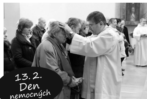
13. 2. Den nemocných