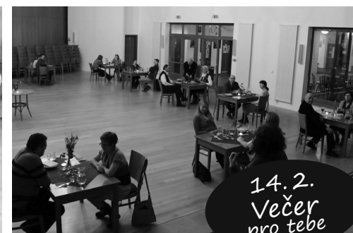
14. 2. Večer pro tebe