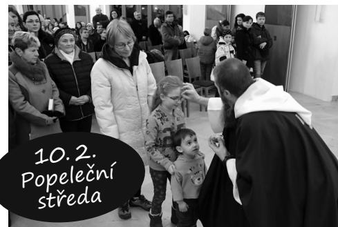
10. 2. Popeleční středa