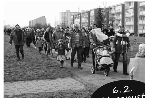
6. 2. Masopust na Jižáku