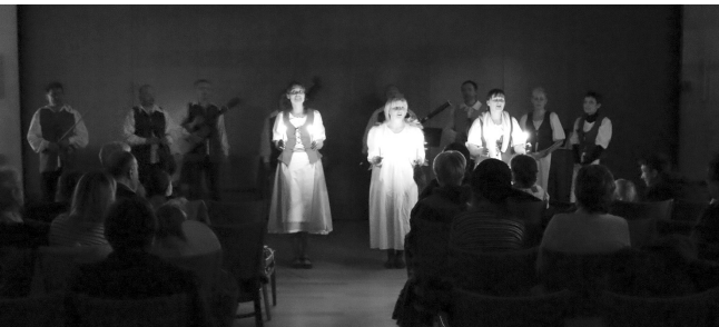
7. 12. / Adventní koncert – Musica Rustica „Přišli jsme k vám na koledu“