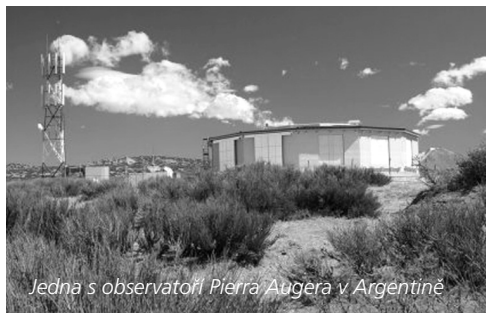
Jedna s observatoří Pierra Augera v Argentině

Nejenergetičtější částice, které k nám přilétají z vesmíru, tedy kosmické záření, byly objeveny už před více než 100 lety. Bylo to těsně po objevu radioaktivity, která rovněž produkuje vysoce energetické částice. Tehdy se předpokládalo, že když se dostaneme dál od zdroje radioaktivity, tedy od Země, tak by měl tok takových částic slábnout. Za pomoci šplhání na věže, například Eiffelovu, a následné měření za pomoci balónů, se ale ukázalo, že mnoho částic nevzniká na Zemi, ale přilétá z vesmíru – bylo tak objeveno kosmické záření a založena částicová fyzika.