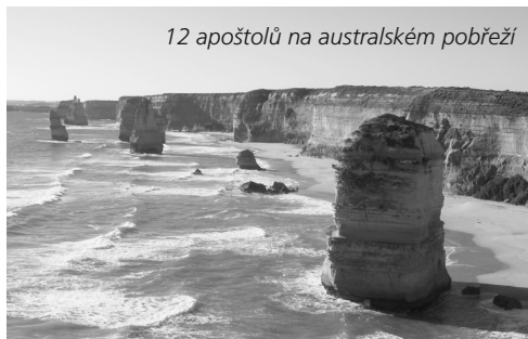
12 apoštolů na australském pobřeží

tvím skvělých fotek a živého vyprávění s sebou. Prožili jsme, jak se v Austrálii dá cestovat, studovat, vyhnout se žralokům, krokodýlům a hadům, potkat klokana, koalu, pavouky, jezdit na surfu, potkat surfové šampiony, slunit se o Vánocích, objet campinovým vozem mnoho set kilometrů kolem pobřeží, krásnějšího a pestřejšího, než byste čekali, strávit Silvestra v Sydney. Moc děkujeme.