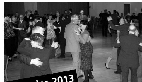
Farní ples 2013