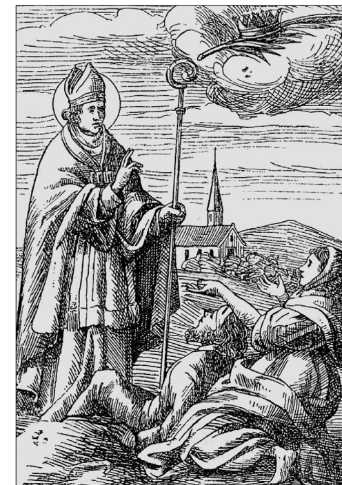
Sv. Valentin – uzdravení posedlého (stará rytina)