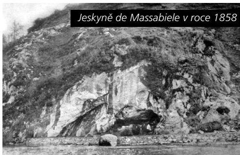
Jeskyně de Massabiele v roce 1858

Ale i u nás, blízko nás jsou také nádherné malé Lurdy, svým obsahem obrovské – naše nemocnice, různá sociální zařízení, kde je mnoho těch, kteří také touží po naději a lásce. Často čekají na naši pomoc, na náš úsměv, na naše povzbudivé slovo. Proto jistě platí také výzva k lékařům, zdravotníkům: přidejte ke každému léku trochu lásky.