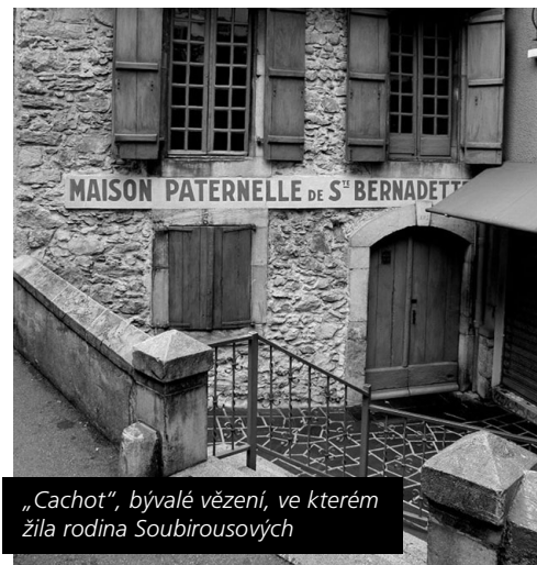
„Cachot“, bývalé vězení, ve kterém žila rodina Soubirousových

Prosba o přimluvu za uzdravení k Panně Marii Lurdské