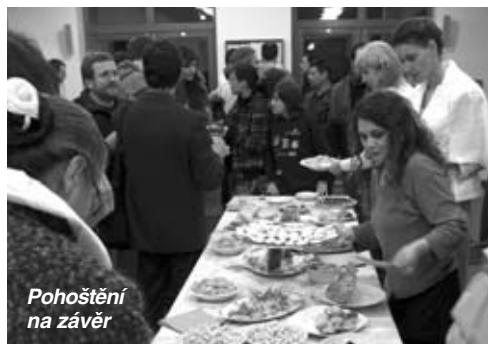
Pohoštění na závěr