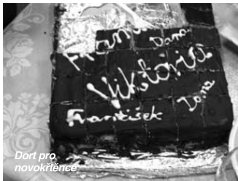
Dort pro novokřtěnce

Ano, po třiceti letech mého života v rodné Praze jsme s rodinou udělali zásadní krok a změnili styl života. Bydlíme ve vesnici Bohdaneč, kde je okolo nás spousta hlubokých lesů, rybníků a lesních pramenů. Kostelík máme třicet metrů od našeho domu a taky se mi líbí, že jeho věž vidím skoro ze všech oken. Takže o složitosti návštěvy nedělní bohoslužby nemůže být řeč! A protože mě to do kostela opravdu táhne, tak si čas udělám i v týdnu, ale to už není v tom našem, ten je otevřený jen v neděli. Střídám kostely v blízkém okolí.