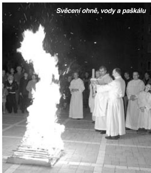
Svěcení ohně, vody a paškálu