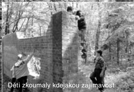
Děti zkoumaly kdejakou zajímavost

Karlštejn Dub Sedmi bratří Malá Amerika Bubovické vodopády Kubrichtova bouda Srbsko