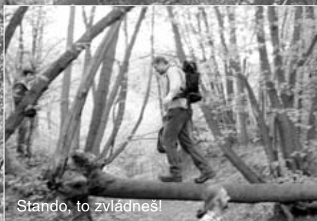
Stádo, to zvládneš!