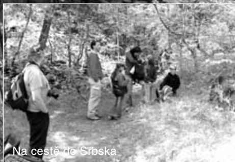
Na cestě do Srbska