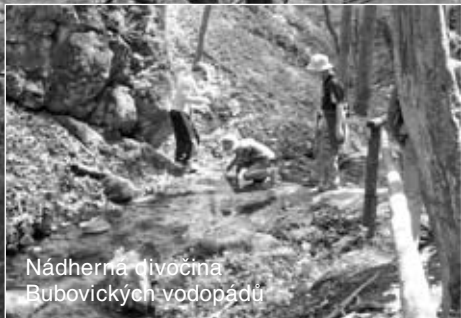
Nádherná úvočina Bubovických vodopádů