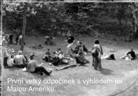
První velký odpočinek s výhledem na Malou Ameriku