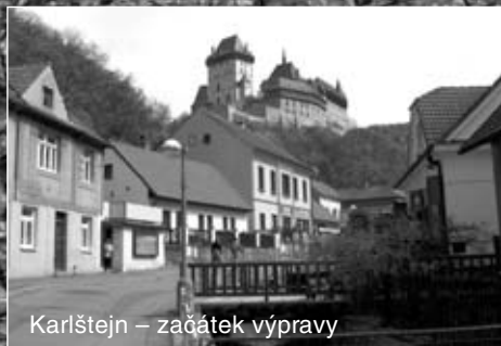
Karlštejn – začátek výpravy