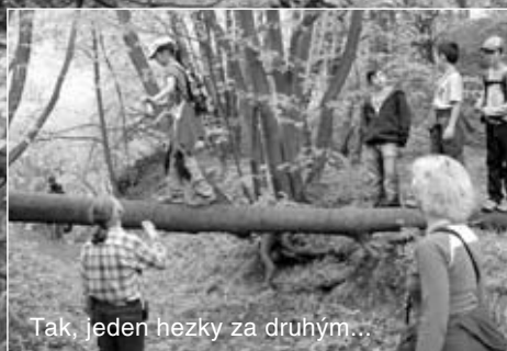
Tak, jeden hezky za druhým...

Karlštejn Dub Sedmi bratří Malá Amerika Bubovické vodopády Kubrichtova bouda Srbsko