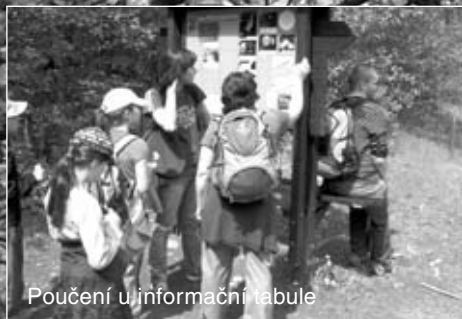
Poučení u informační tabule