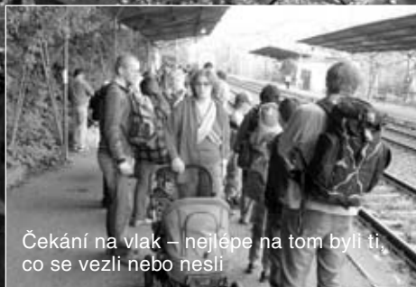
Čekání na vlak – nejlépe na tom byli ti, co se vezli nebo nesli