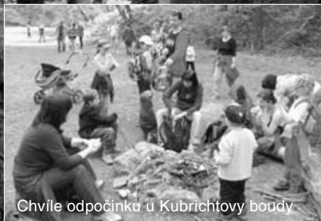
Chvilke odpočinku u Kubrichtovy boudy