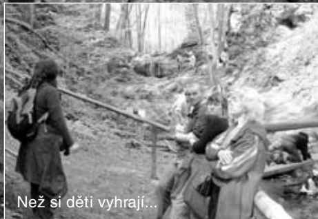
Než si děti vyhrají...