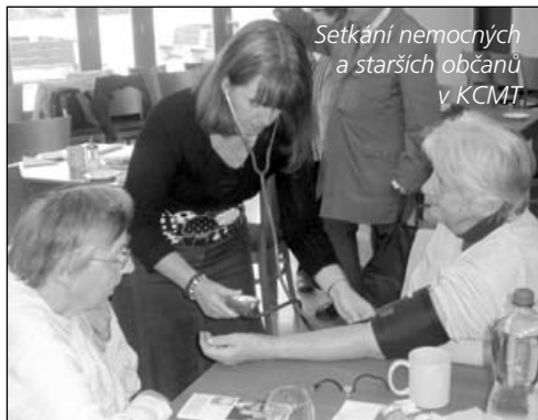
Setkání nemocných a starších občanů v KCMT.