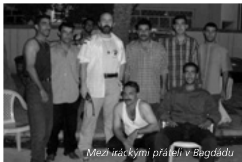
Mezi iráckými přáteli v Bagdádu