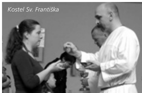
Kostel Sv. Františka

Počítám, že moje domovská farnost a zakotvení bude zde na Chodově. Jedním z úkolů v rámci přípravy k jáhenství je začít pracovat pro farnost. Začal jsem jako ministrant sloužit u oltáře v kostele sv. Františka. Tam bych chtěl pokračovat dál. Po svěcení bych mohl vykonávat liturgické úkony a další úkoly spojené se službou trvalého jáhna.