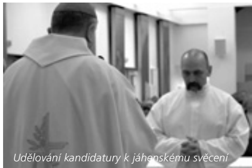
Udělování kandidatury k jáhenskému svěcení