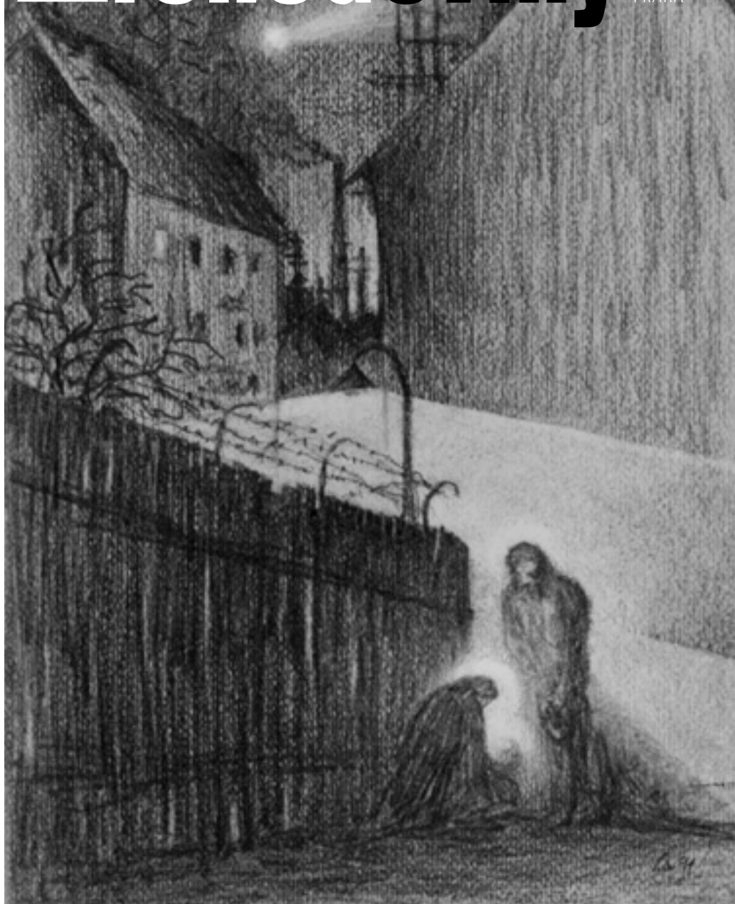
„NEBYLO PRO NĚ MÍSTO“ – nakreslil Benedikt V. Holota

12 / 2010 ZPRAVODAJ FARNOSTI CHODOV PRAHA