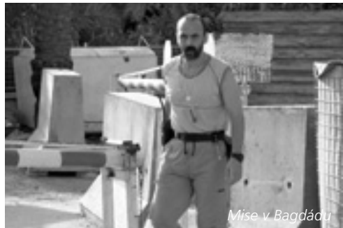
Mise v Bagdádu