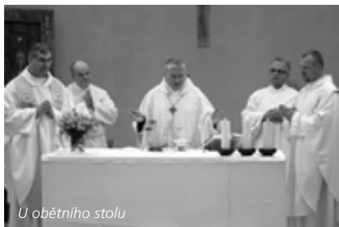
U obětního stolu