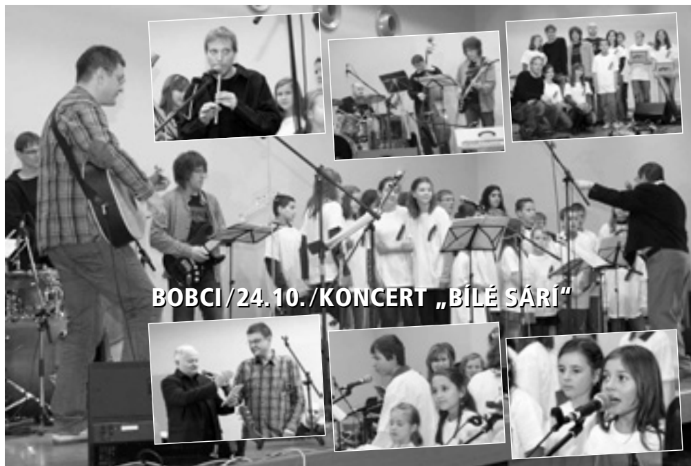
BOBCI/24.10./KONCERT „BÍLÉ SÁŘÍ“