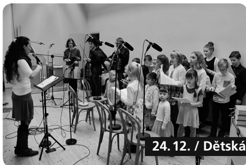
24. 12. / Dětská půlnoční mše sv.