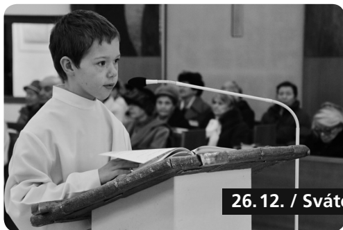
26. 12. / Svátek sv. Štěpána