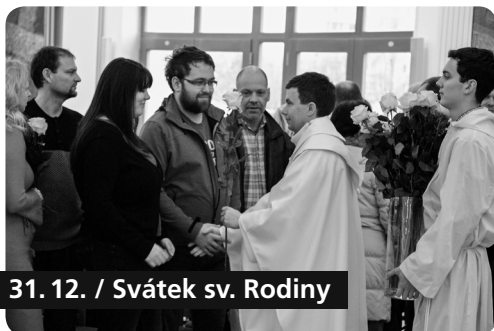
31. 12. / Svátek sv. Rodiny