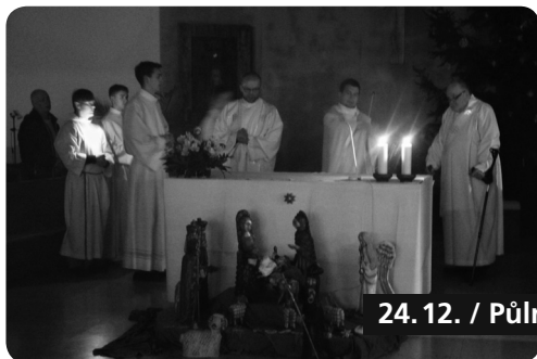
24. 12. / Půlnoční mše sv.