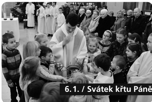
6. 1. / Svátek křtu Páně