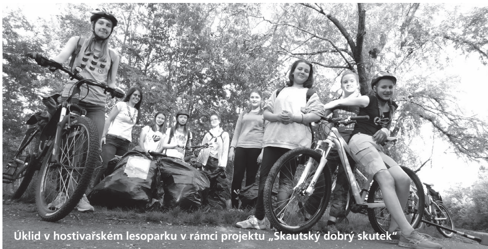
Úklid v hostivařském lesoparku v rámci projektu „Skautský dobrý skutek“

Ve středu jsme se vydaly do Alzheimerhausu Zátíší v Kunraticích, abychom potěšily tamní lidi. Sešli jsme se o něco dříve, abychom stihly autobus do Kunratic. Těsně nám ujel. Nakonec jsme šťastně dojely. Obyvatelům domu jsme zazpívaly písně a zahrály jsme Večernička. Pak jsme snědly pár jednohubek a trochu jsme se napily šťavy.