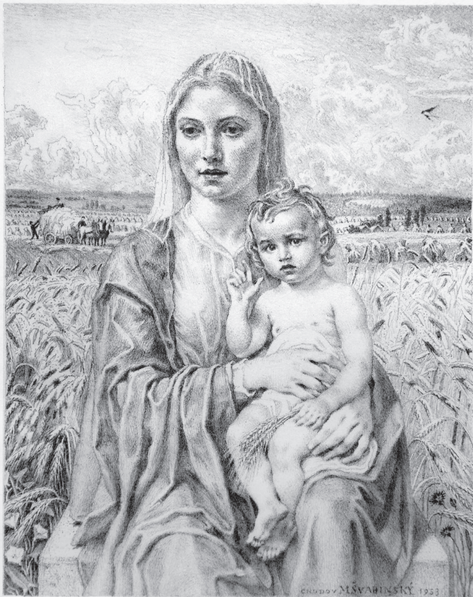
Chodovská Madona, litografie, 1953