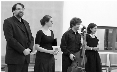
19. 9. / „Stabat Mater“ – koncert Musica cum gaudio