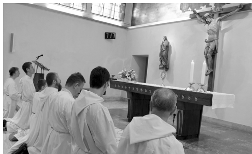
4. 9. / Mše svatá k výročí posvěcení kostela sv. Františka