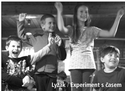
Lyžák / Experiment s časem

Večery na Jitřence patřily filozofii. Formou her, experimentů, rozboru filmových ukázek a diskusí jsme se dotkli šesti stěžejních filozofických témat: co je to filozofie, co je to pravda, co je to čas, co je