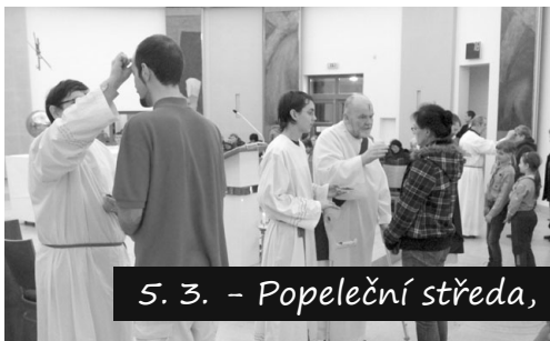
5. 3. - Popeleční středa, mše sv. s udílením popelce