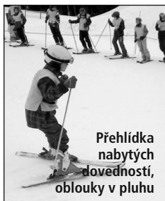
Přehlídka nabytých dovedností, oblouky v pluhu