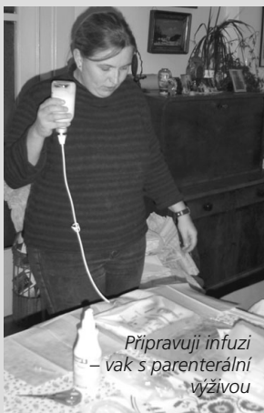
Připravuji infuzi – vak s parentální výživou