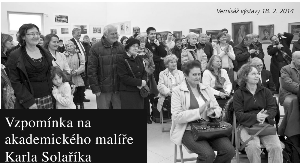
Vernisáž výstavy 18. 2. 2014