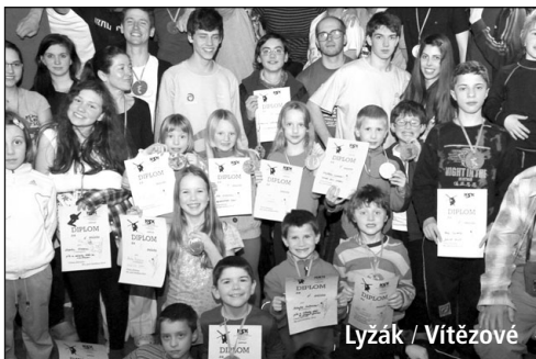
Lyžák / Vítězové