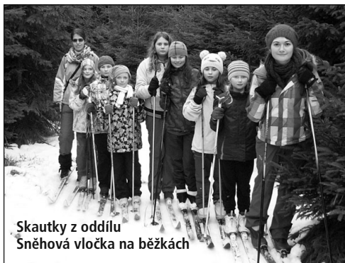
Skautky z oddílu Sněhová vločka na běžkách

Skautský oddíl Sněhová vločka prožil krásné jarní prázdniny spolu s oddílem Mayů v Háji pod