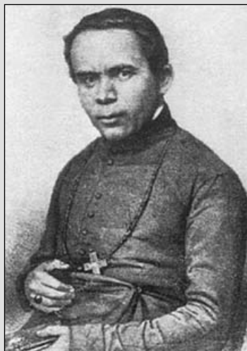
Sv. Jan Nepomuk Neumann (28. 3. 1811 – 5. 1. 1860)

Byl uchvácen myšlenkou stát se misionářem v Americe, a když pro nadbytek farářů v Čechách nemohl být vysvěcen na kněze, tak bylo rozhodnuto. Nastoupil strastiplnou cestu do neznáma za moře. Po 40 dnech na palubě lodi Europe vystoupil 2. června 1836 na pevninu „Nového světa“ v New Yorku. Hned vyhledal kostel a děkoval Bohu za splnění snu, ale s prací byl teprve na počátku. Neúnavně působil jako duchovní správce v oblasti Bufala a Niagarských vodopádů. Ze všech sil se věnoval nemocným, osamoceným, umírajícím, mládeži, dětem a také Indiánům – „dětem přírody“, jak je nazýval. Díky své pracovitosti a neochvějné víře v Boha se stal v roce 1852 biskupem ve Philadelphii. Rodné Prachatice ještě jednou navštívil v roce 1853, když služebně cestoval do Vatikánu a přitom se zastavil na Šumavě, kde byl se všemi poctami biskupa uvítán. Nikdo nikdy neviděl Neumanna zahálet a při práci také skonl. Srdeční infarkt ho zasáhl přímo na ulici ve Philadelphii dne 5. ledna 1860.